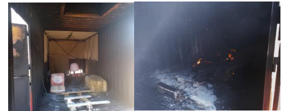
Quema de diferentes materiales en un contenedor. Puerto de Prácticas de Bomberos de Sevilla (julio 2021).