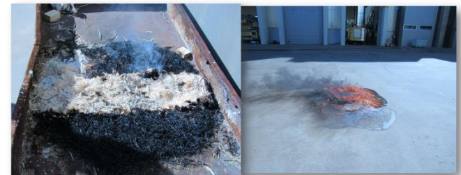
Quema en bandejas y sobre líquidos inflamables al aire libre. Parque de Bomberos de Cádiz ( octubre 2020).